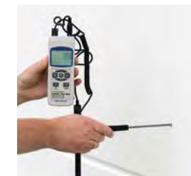
Messung der Bauteil- und Untergrundfeuchte, Taupunktbestimmung