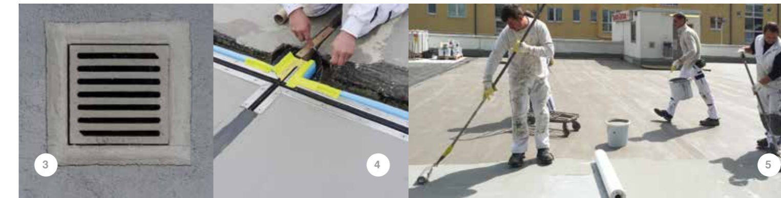
3_ Zuverlässige Flächenentwässerung 4_ Fugen-Detail-Ausbildung 5_ Aufbringen der zweiten Beschichtungslage

die Ausführung durch unsere geschulten Facharbeiter und ein fester Ansprechpartner. Ein Bauingenieur der K-T-K leitete das Projekt – von der Analyse bis zur Fertigstellung. Schnittstellenfrei aus einer Hand.